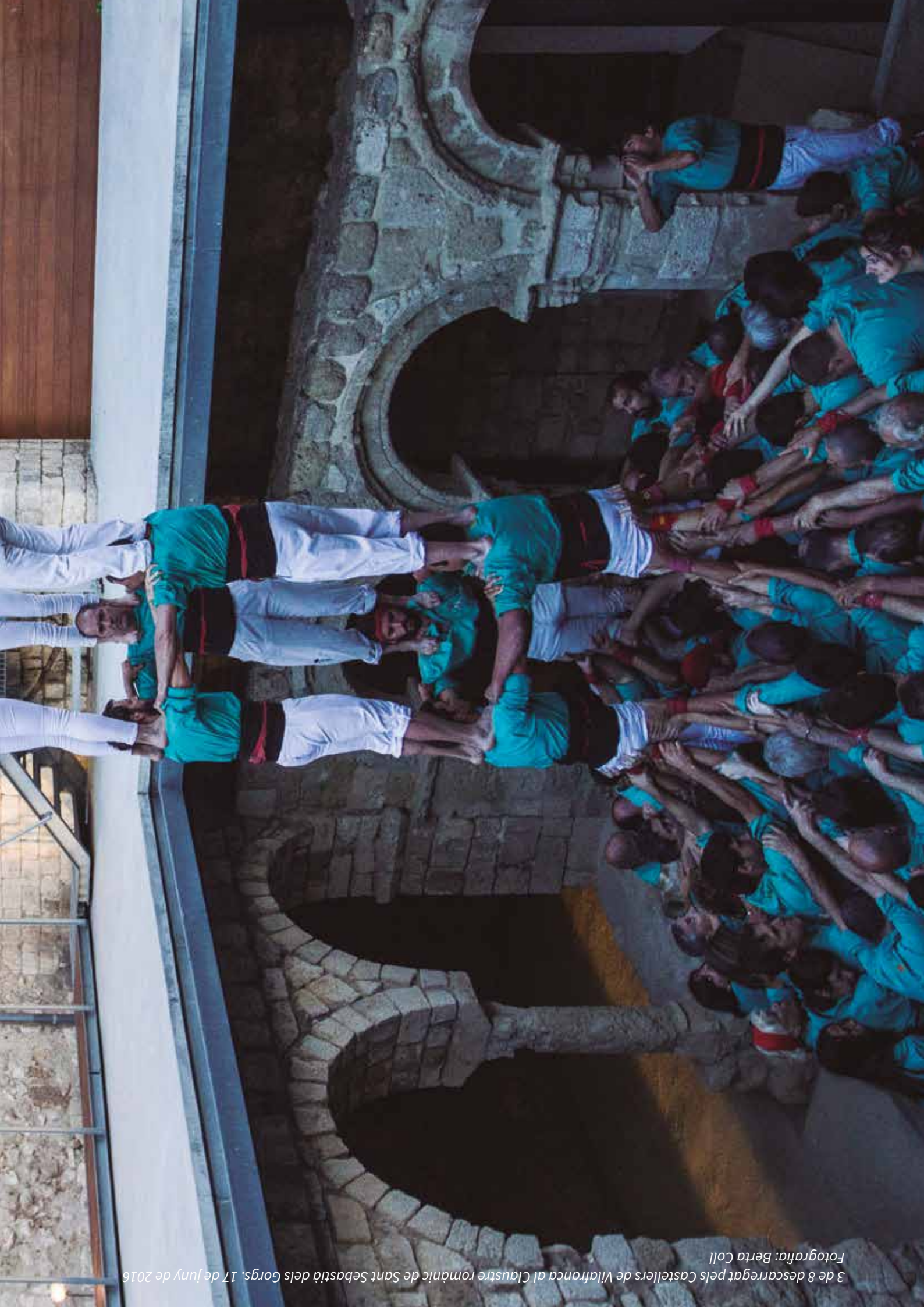
3 de 8 descarregat pels Castellers de Vilafranca al Claustre romànic de Sant Sebastià dels Gorgs. 17 de juny de 2016