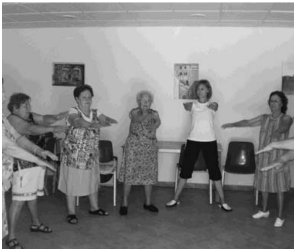
Gimnàstica Adaptada al Centre Cívic "Els Gorgs" a Sant Sebastià dels Gorgs