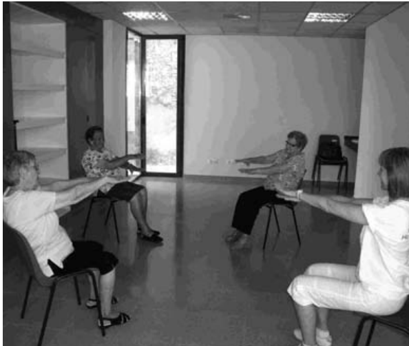
Gimnàstica Adaptada al Casal de Gent Gran d'Avinyó Nou

També s'hi poden trobar els dies i horaris de les activitats que es realitzen des del mes de setembre fins al mes de juliol, així com d'altres activitats de caràcter més puntual com són la sessió pràctica a l'Espai Lúdic, el taller de memòria o el taller "Fem Sabó".