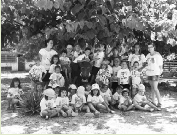
Sortida a Can Descregut