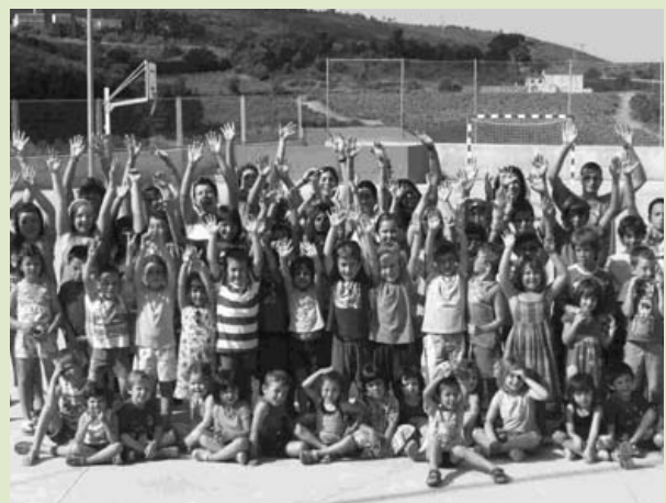
Foto de tot el grup del Casal 2011