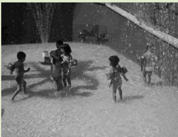
Sortida Illa Fantasia

Des de l'Ajuntament volem felicitar a tot l'equip de monitores i ajudants del casal per la feina realitzada i agrair a les famílies dels infants la confiança que dipositen en el projecte i les valoracions que ens han fet arribar.