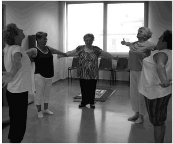
loga al Casal de Gent Gran d'Avinyó Nou