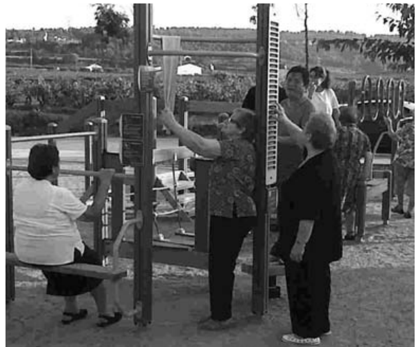
Sessió pràctica a l'Espai Lúdic