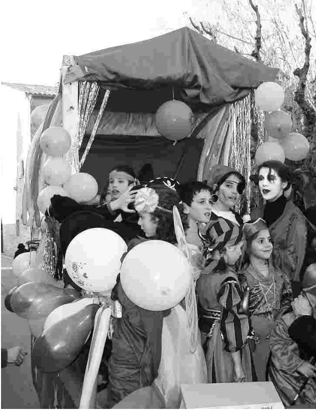
Els més petits van ser els protagonistes del Carnaval a Cantallops