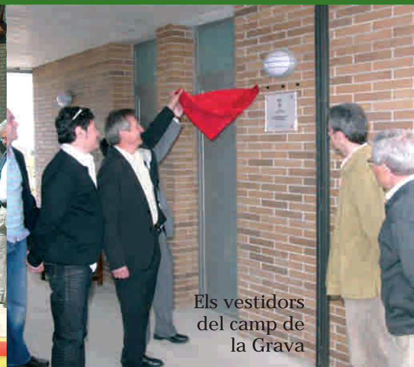
Els vestidors del camp de la Grava