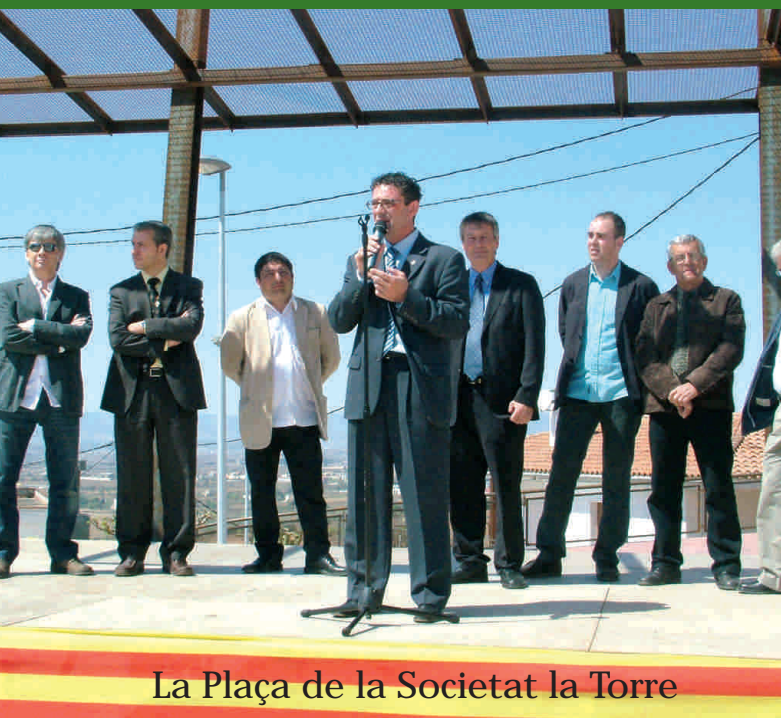
La Plaça de la Societat la Torre