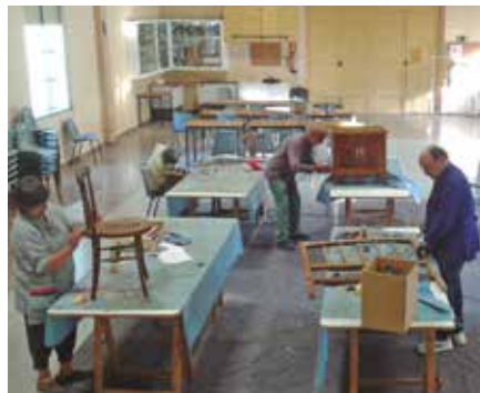
Restauració de mobles